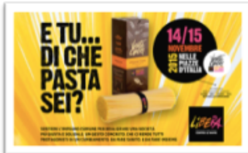
Cover/Banner per i social