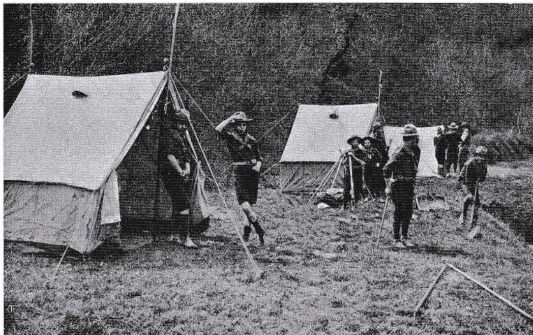
Il "camping" è la migliore scuola di solidarietà