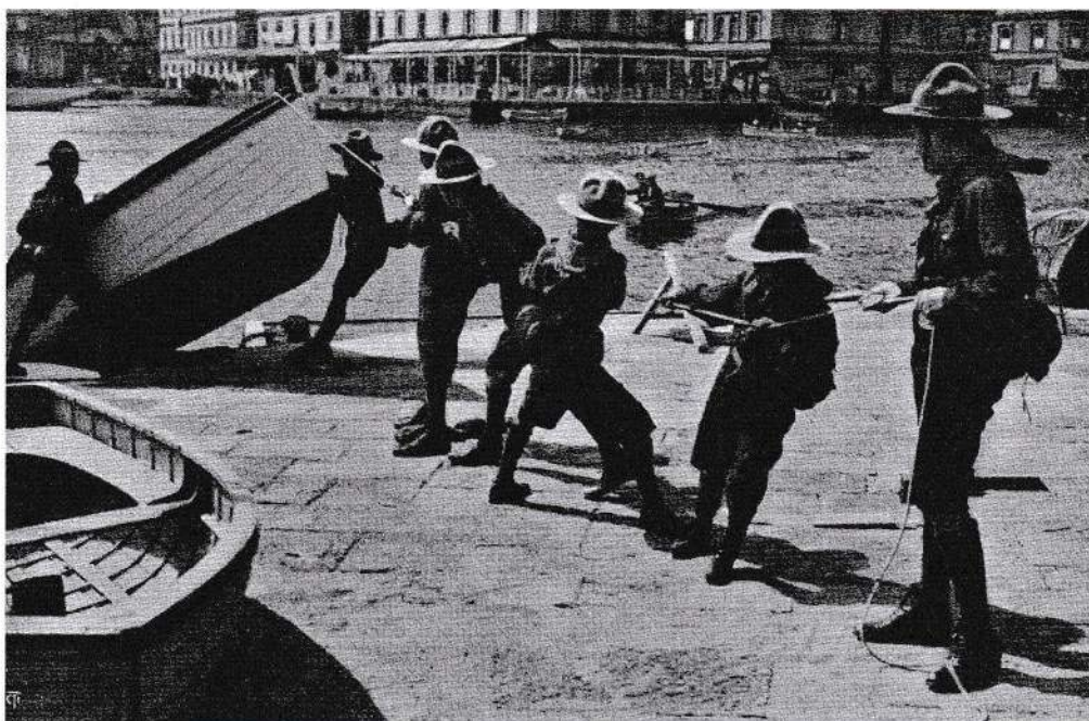
I Ragazzi esploratori italiani (sezione di Napoli) alla marina

nelle località ove la natura è ostile, ove bisogna ogni giorno lottare contro difficoltà ad ogni specie e contro le belve, gli uomini abbondano di energia, di coraggio, di ardimento. Bisogna dunque, se si vuole reagire contro l'indebolimento della razza, abituare i ragazzi ad un'esistenza rude avventurosa". E creò i boy-scouts (fanciulli sentinelle). L'istituzione ebbe un successo straordinario, ed il successo è facilmente