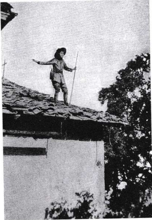
Come un "giovane esploratore d'Italia" esplica il suo spirito di iniziativa

libro: "Scouting for Boys": "Parecchi ufficiali mi domandano continuamente di introdurre gli esercizi militari nei giochi dei "boy-scouts". Ma dopo 34 anni di esperienza, pur riconoscendone il valore nei riguardi della disciplina, ne scorgo chiaramente i pericoli: l'esercizio militare tende a distruggere l'individuo, mentre, al contrario, noi desideriamo svilupparne il carattere. E quando l'esercizio non ha più il sapore della novità, finisce con l'annoiare il fanciullo. L'esercizio militare spegne il suo entusiasmo, mentre noi vogliamo fare dei nostri ragazzi altrettanti uomini in pienezza di moto e non dei soldati per ridere".