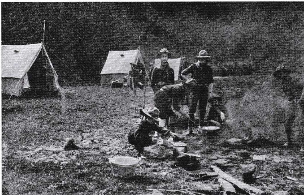
I Ragazzi esploratori italiani (sezione di Napoli) preparano il rancio